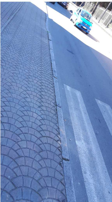
7 VIA DANTE