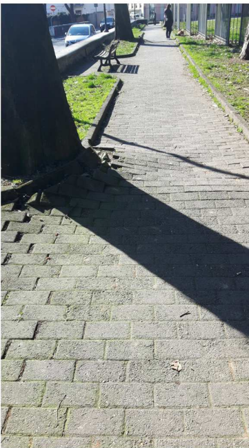
4 VIA DANTE