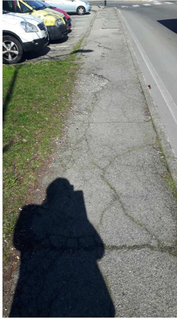
2 MONTE BIANCO