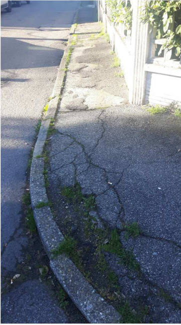
1 S. AMBROGIO