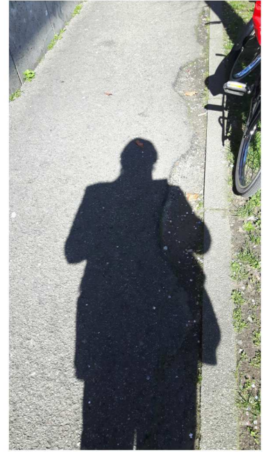
3 MONTE BIANCO