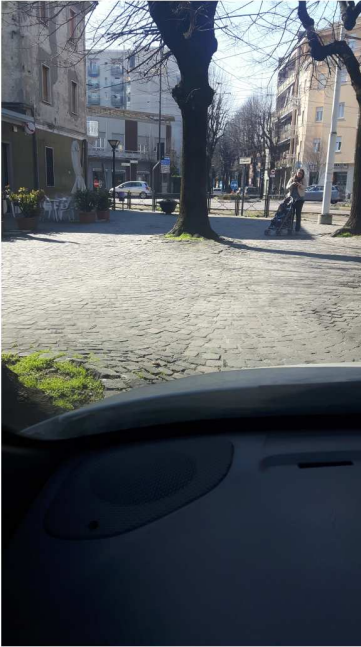
1 P.ZZA 5 GIORNATE