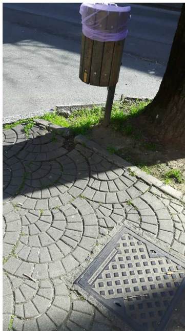
8 VIALE PIAVE