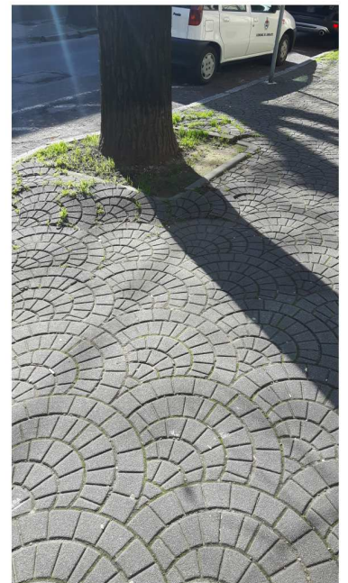
9 VIALE PIAVE