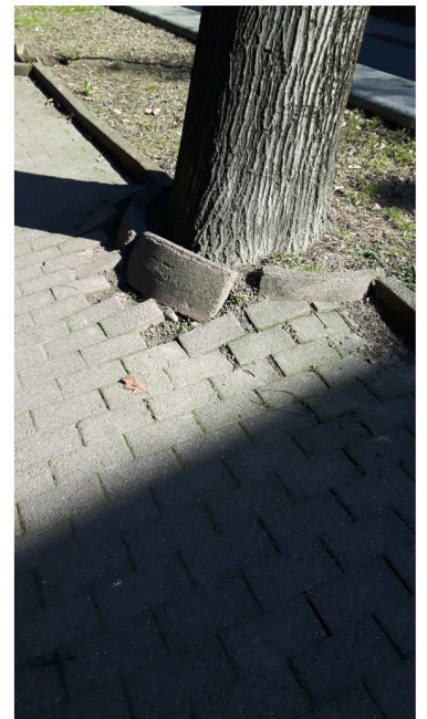
6 VIA DANTE