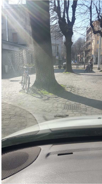
2 P.ZZA 5 GIORNATE