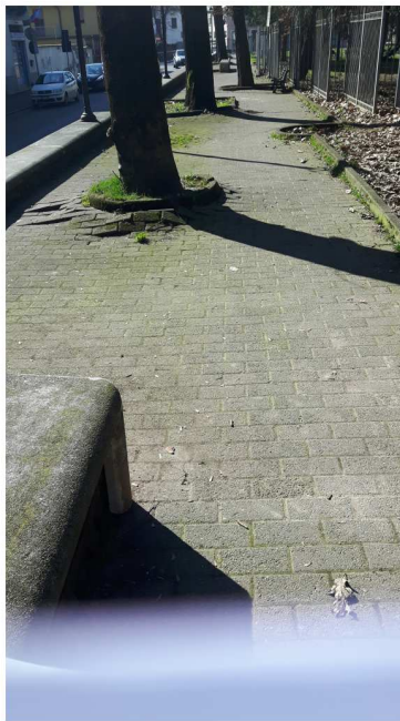
5 VIA DANTE